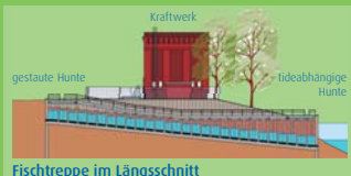
Fischtrappe im Längsschnitt

Das Kraftwerks-Gebäude und die Hubtore bilden einen Sperrriegel in der Hunte. Wanderfische wie Lachs, Meerforelle und Flussneunauge konnten diese Stelle nicht passieren. Im Jahr 2006 wurde deshalb eine Fischaufstiegsanlage (»Fischtrappe«) gebaut. Dank dieser Trappe können wandernde Fische in Richtung Huntmündung oder Flussoberlauf weiterziehen.