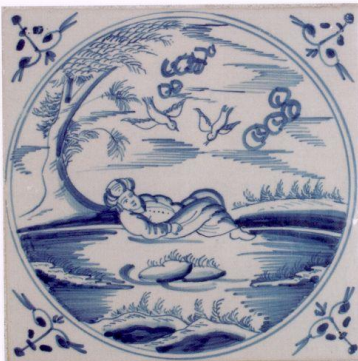
O 216 1. Könige 17