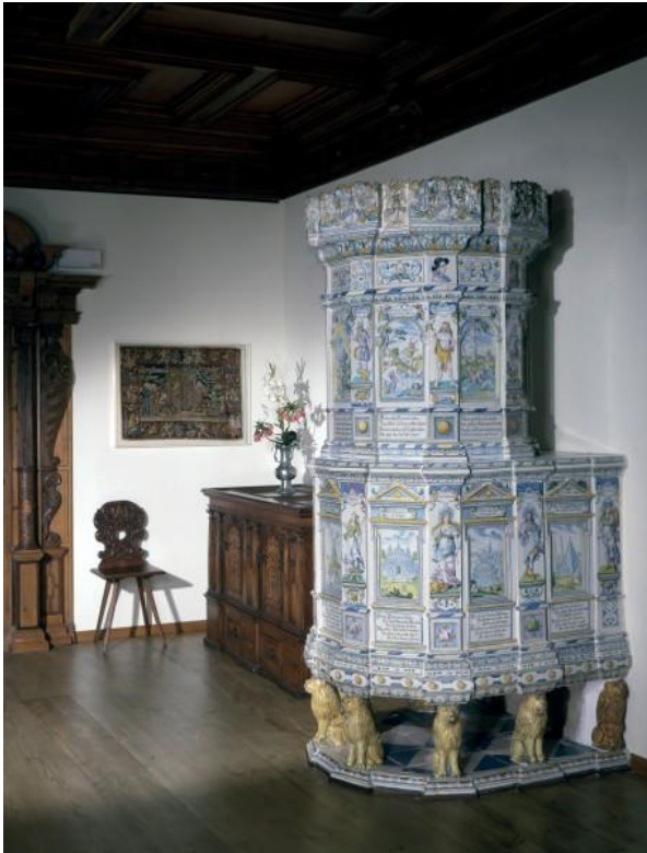
Schweizer Fayence-Turmofen von Pfau & Graf