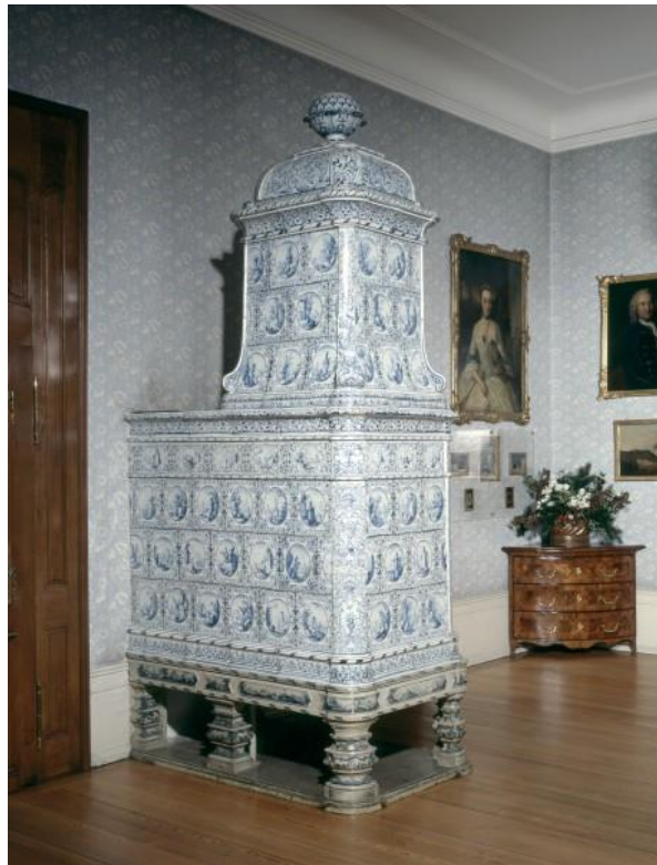
Schweizer Fayence-Turmofen von Leonhard Lochert