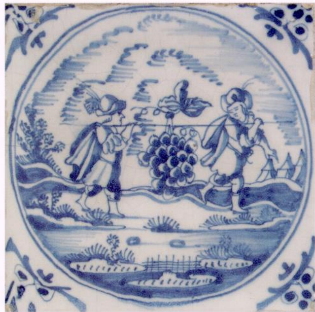
O 115 4. Mose 13